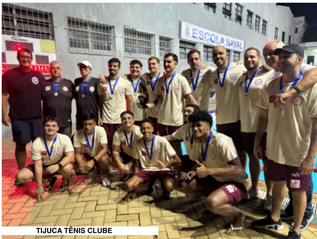
TIJUCA TÊNIS CLUBE