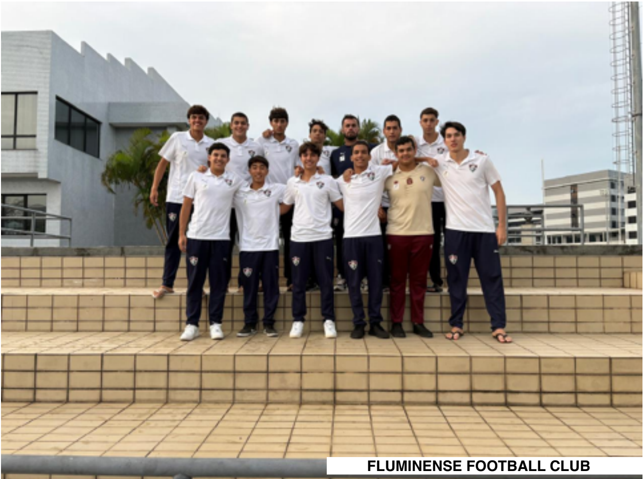
FLUMINENSE FOOTBALL CLUB