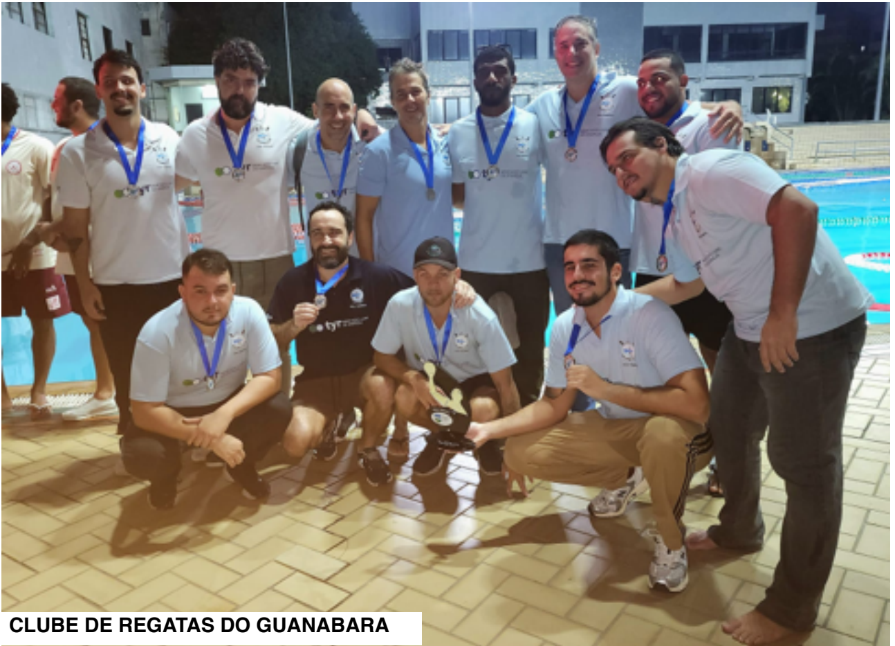
CLUBE DE REGATAS DO GUANABARA