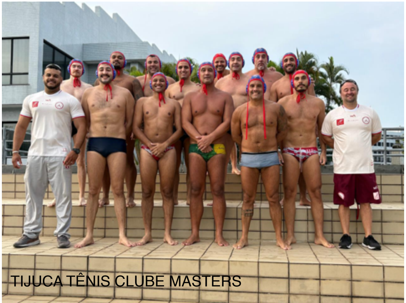
TIJUCA TÊNIS CLUBE MASTERS