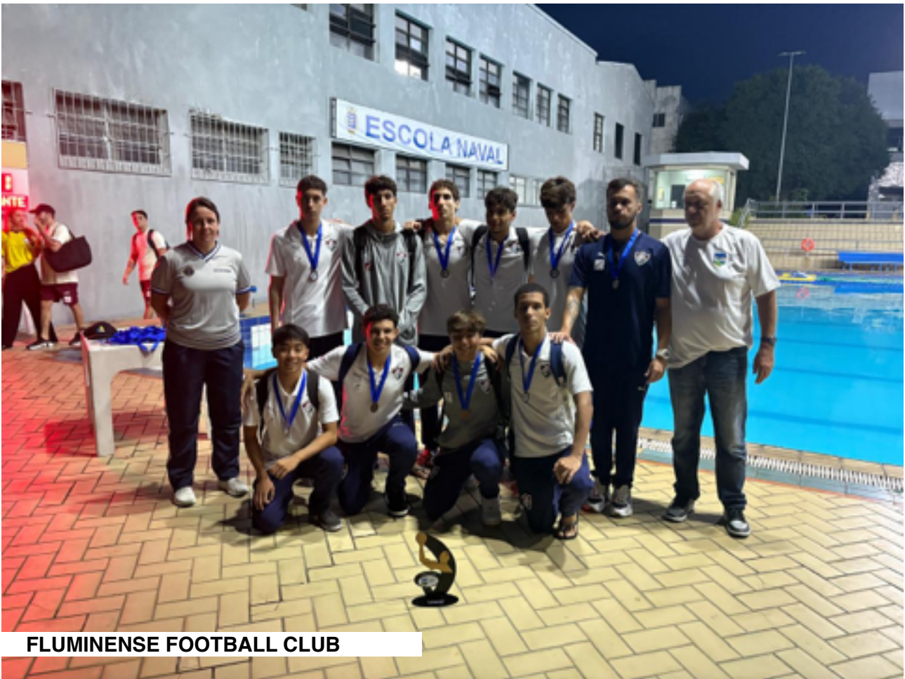
FLUMINENSE FOOTBALL CLUB